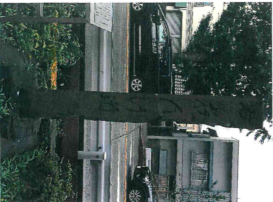
「あんげ道」の道標（追分交差点）