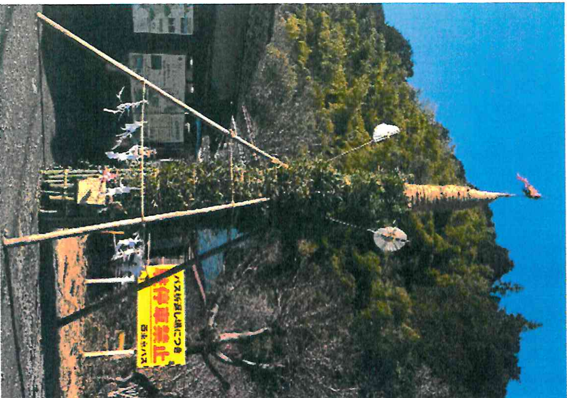
上案下のセエノカミ (八王子市指定無形民俗文化財)